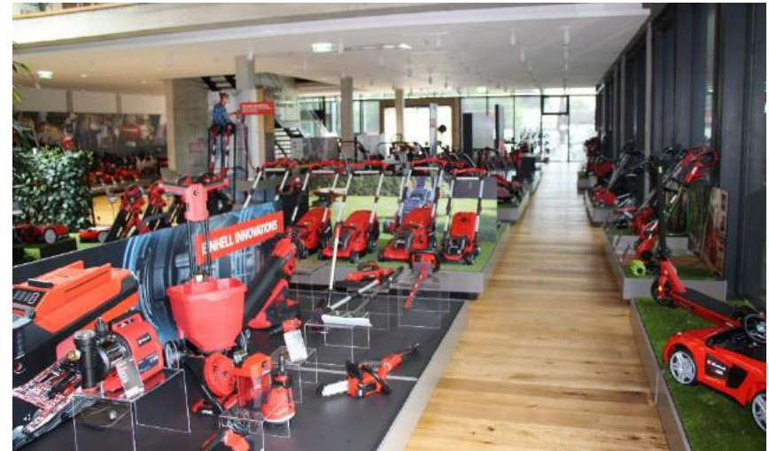
Une sélection de produits Einhell