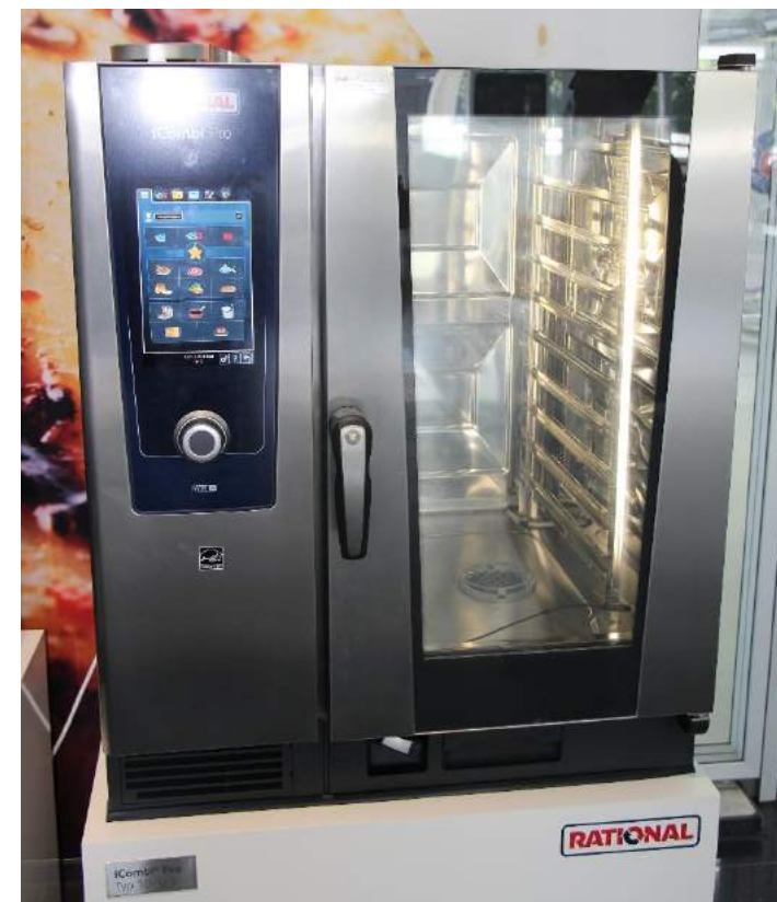
Le four iCombi Pro de Rational