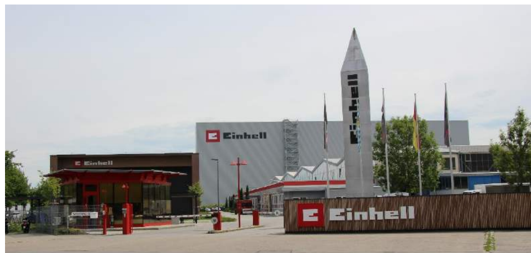
Siège de la société Einhell avec le nouveau entrepôt automatisé

Développement et distribution de machines de bricolage et de jardinage comme facteur principal de croissance