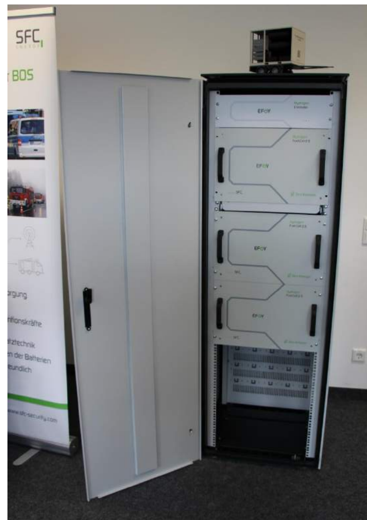
Une pile hydrogène