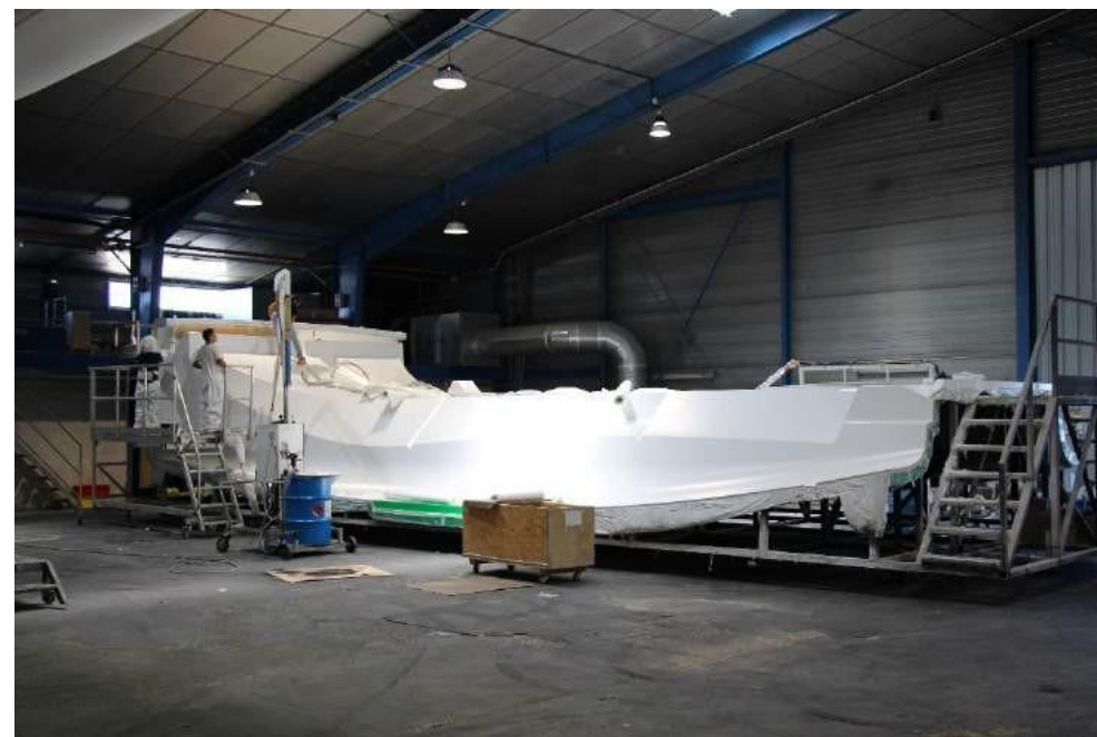
Realizzazione di uno scafo