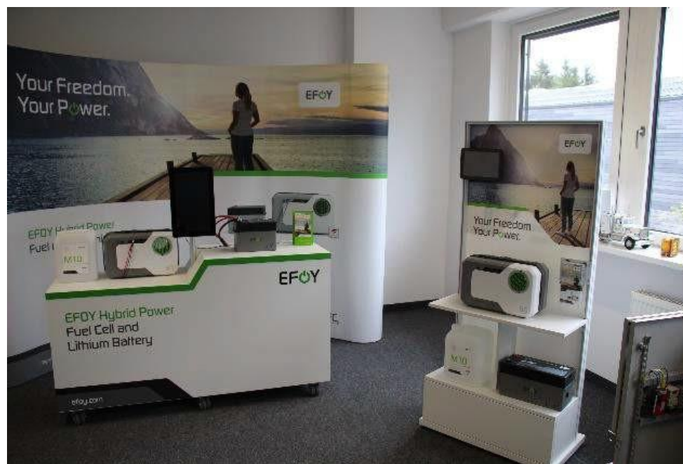
Batterie al metanolo

Pioniere nello sviluppo e nella produzione di celle a combustibile , con già 55.000 celle vendute sul mercato internazionale; prodotti tecnicamente ed economicamente vantaggiosi (costi di esercizio) e rispettosi dell'ambiente (energia pulita)