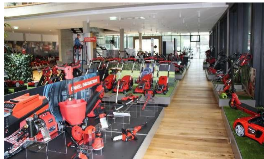
Una selezione di prodotti Einhell