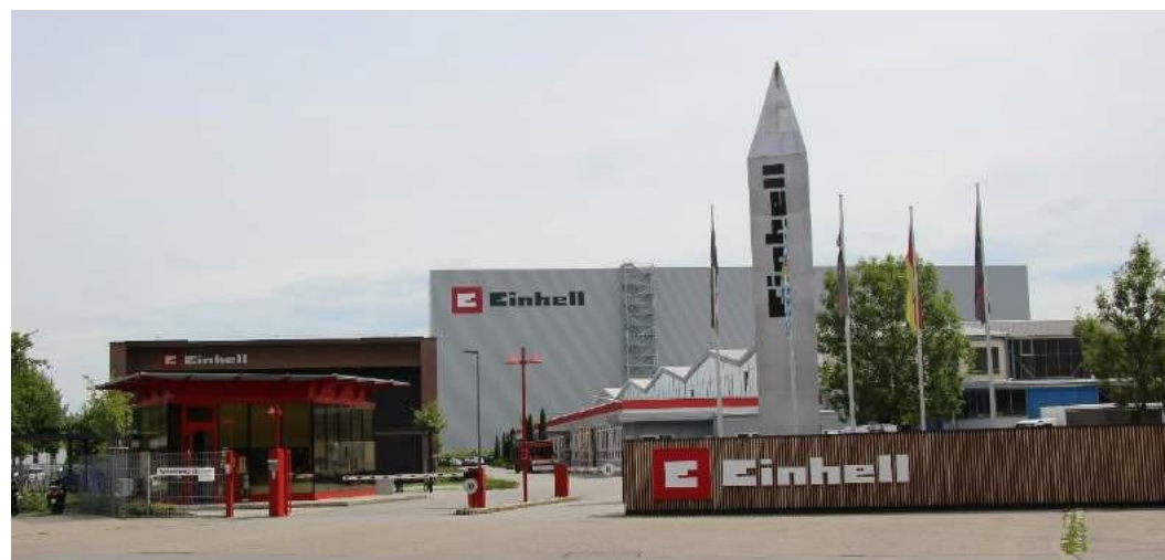
La sede centrale di Einhell con il nuovo magazzino automatizzato

Sviluppo e distribuzione di macchine per il fai-da-te e il giardinaggio come motore di crescita fondamentale