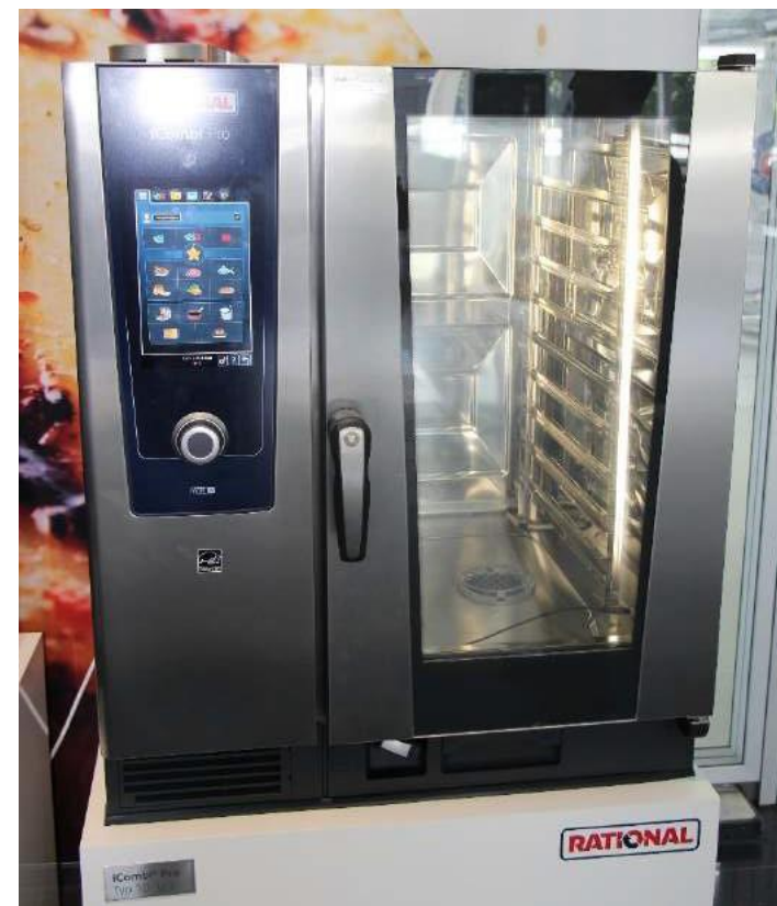
Le four iCombi Pro de Rational