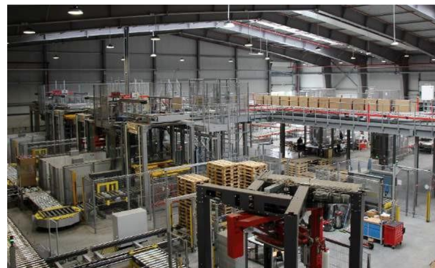
Il nuovo magazzino all'avanguardia