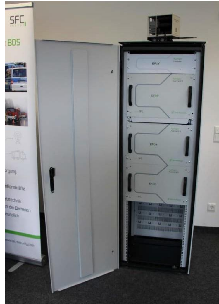
Una cella a combustibile a idrogeno